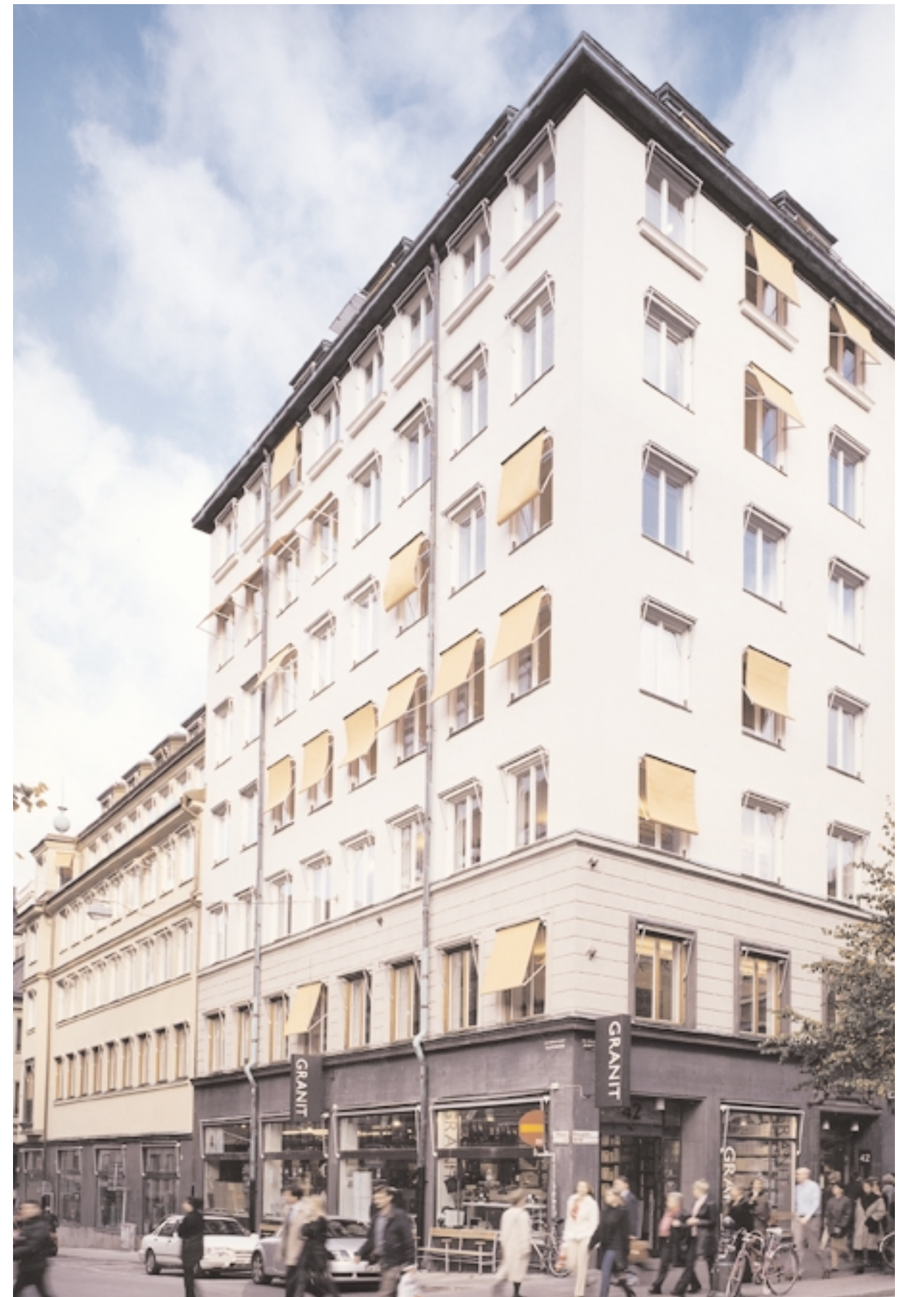
Hästhuvudet 3 byggdes om rejält så sent som år 2000 då Hufvudstaden förverkligade det sedan länge existerande bygglovets »på höjden«. Den omsorgsfulla påbyggnaden smälter in så pass väl att en utomstående betraktare har svårt att se var det gamla slutar och det nya tar vid.

Nu är båda husen omsorgsfullt renoverade och utrustade med senaste teknik vad gäller kommunikation och miljö.